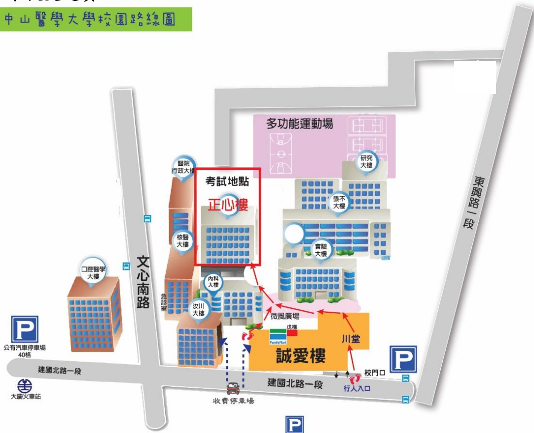
中山醫學大學校園道路系統圖